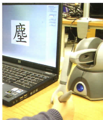
▲ 受訓者可通過觸感仿真裝置的控制器進行手部訓練，圖為進行寫字訓練的觸感仿真平台。

如欲查詢理大的科研技術或知識轉移服務資料，可瀏覽 www.ife.polyu.edu.hk ，亦可致電 3400 2929 或電郵至 lemon.kwan@polyu.edu.hk 與關先生聯絡。